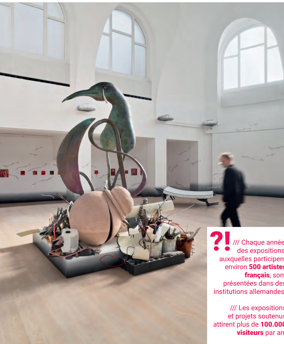
Exposition de l'artiste française Camille Henrot au Kestner Gesellschaft de Hanovre.

?! /// Chaque année, des expositions, auxquelles participent environ 500 artistes français , sont présentées dans des institutions allemandes.