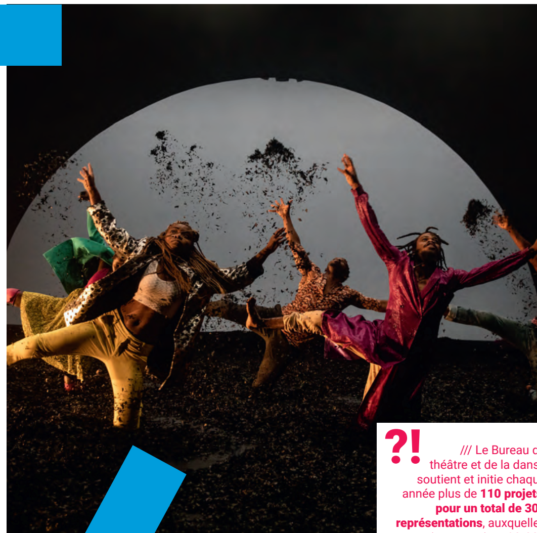
Wakatt, chorégraphie de Serge Aimé Coulibaly.

?! /// Le Bureau du théâtre et de la danse soutient et initie chaque année plus de 110 projets , pour un total de 300 représentations , auxquelles assistent environ 90.000 spectateurs .