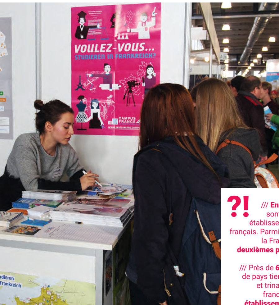
Campus France informe des étudiantes allemandes intéressées par des études en France.

Dans le domaine de l'enseignement supérieur, l'Institut français d'Allemagne encourage le développement de partenariats entre établissements d'enseignement supérieur , aide à la reconnaissance mutuelle des diplômes universitaires et professionnels, conseille de manière ciblée sur les possibilités d'études en France et organise des débats et conférences sur des questions d'actualité. Le Bureau de coopération universitaire et son bureau d'information Campus France travaillent en étroite collaboration avec l'Université franco-allemande (UFA), l'Office allemand d'échanges universitaires (DAAD) et le centre Marc Bloch. Le bureau coopère également avec l'Ecole Nationale d'Administration (ENA)/ Institut national du service public (INSP) et l'association des anciens élèves allemands de l'ENA.