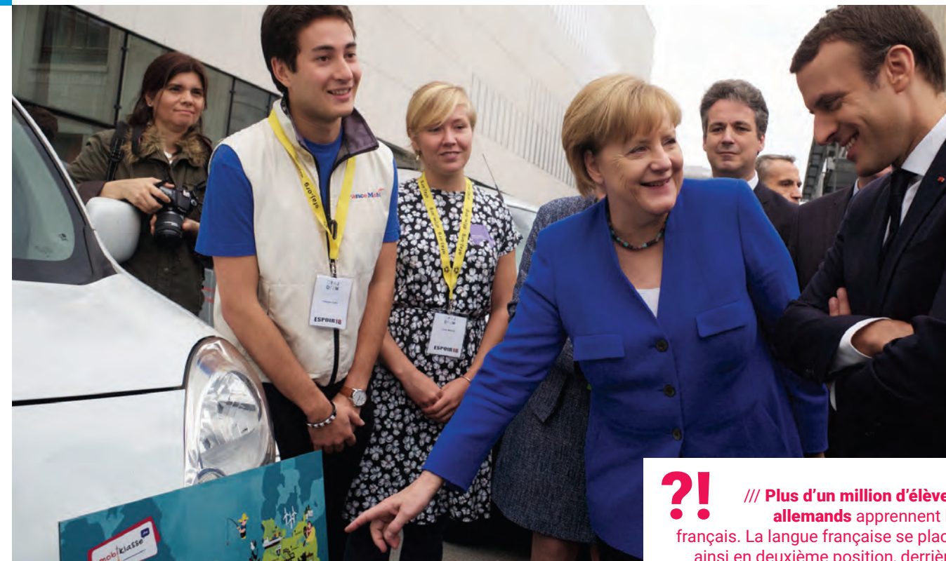
La chancelière allemande Angela Merkel et le Président de la République Emmanuel Macron se renseignent sur FranceMobil.

L'Institut français d'Allemagne promeut la langue et la culture françaises dans le système scolaire allemand. A cet effet, le Bureau de coopération linguistique et éducative organise, avec le soutien de 7 attachés pour la langue et l'éducation répartis dans les régions, des programmes variés pour les élèves , dans toute l'Allemagne. FranceMobil, le Prix des lycéens allemands, Cinéfête, en sont des exemples. Ces programmes sont proposés en coopération avec de nombreux et importants partenaires, comme les ministères de l'Education allemands, la Conférence permanente des ministres de l'Education des Länder, l'association des professeurs et professeures de français, l'Office franco-allemand pour la Jeunesse (OFAJ), le Secrétariat franco-allemand pour les échanges en formation professionnelle, l'Agence pour l'enseignement du français à l'étranger (AEFE), les rectorats d'académie français.