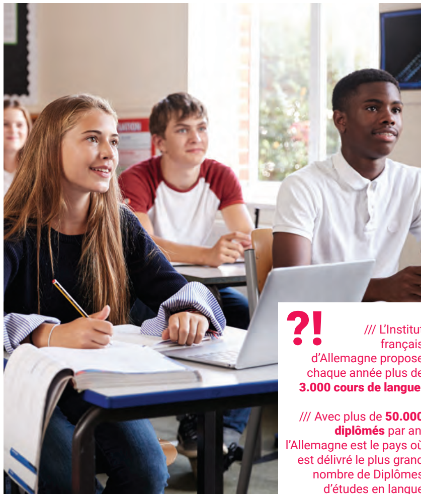
Des cours de langue pour tous les groupes d'âges à l'Institut français d'Allemagne.