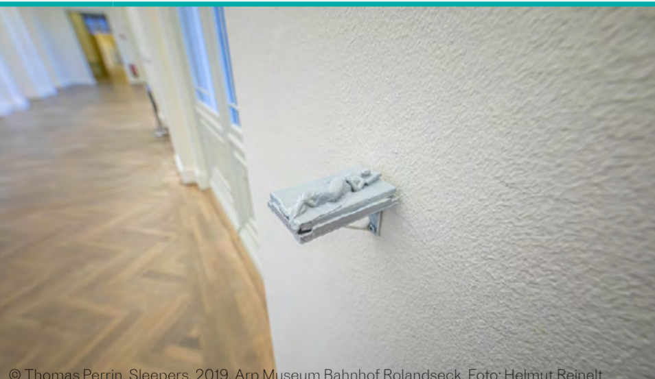
© Thomas Perrin, Sleepers, 2019, Arp Museum Bahnhof Rolandseck, Foto: Helmut Reinelt

18 DO Vorlesestunde für Kinder Heure du conte Lara Vincent liest 'Contes du monde' für Kinder ab 3 Jahren 16 Uhr | Zoom | Anmeldung unter kultur.institutfrancais@uni-bonn.de | f